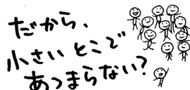
イラスト:西澤真樹子

自然系や人文系など、様々な分野を対象としたミュージアムが各地にあり、日々活動しています。それらの多くは、職員が数名という小規模な施設。それぞれの持つ力は大きいとはいえません。そこで、「小規模ミュージアム＝小さいとこ」に関わっている人や、応援したい人が集まって「小さいとこ」の魅力を発信し、それぞれの交流や情報交換、支援など、みんなで集まって協力しよう！というのが、この小規模ミュージアムネットワーク(＝小さいとこネット)。その交流活動として、年1回開催されるのが「小さいとこサミット」です。